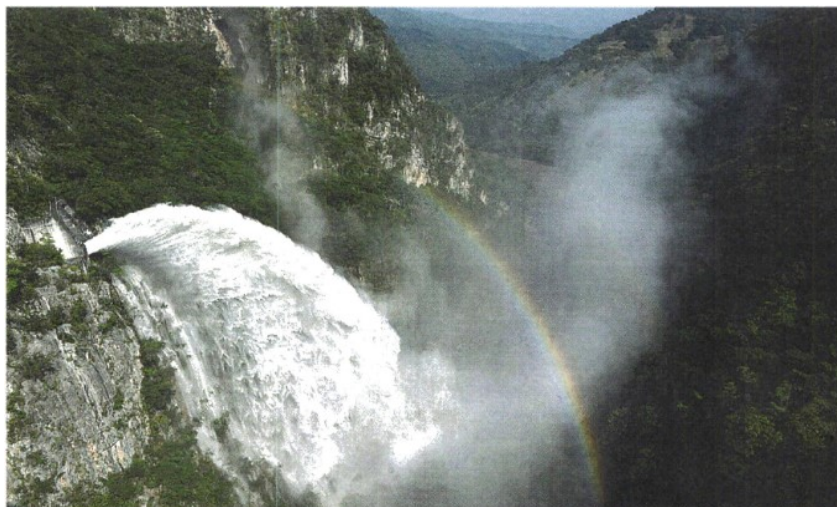
Honduras La centrale idroelettrica conosciuta meglio come El Cajon Dam, a Santa Cruz de Yojoa, 180 km a nord di Tegucigalpa

ARTICOLO NON CEDIBILE AD ALTRI AD USO ESCLUSIVO DI UNIONCAMERE